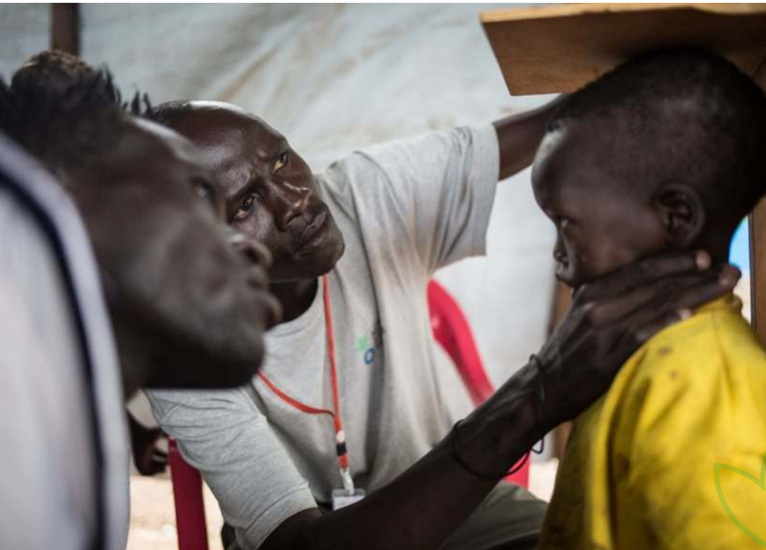
Equipo de Acción contra el Hambre auscultando a un niño para detectar señales de malnutrición. Campamento de Nguégnyiel, Etiopía.

En Etiopía más del 30% de la población continúa viviendo por debajo del umbral de la pobreza y el nivel de desnutrición infantil es uno de los más altos del mundo. A través de este país, el alumnado tendrá la oportunidad de conocer los Objetivos de Desarrollo Sostenible (ODS) y el trabajo de la organización para lograr nuestro objetivo principal: acabar con el hambre en el mundo.