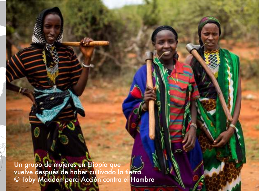
Un grupo de mujeres en Etiopía que vuelve después de haber cultivado la tierra.