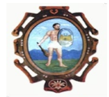
Provincia de Huanta